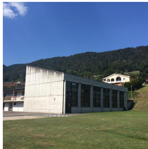
Halle de gymnastique