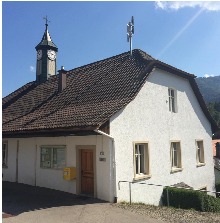
Bâtiment communal / école enfantine